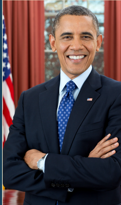
Franklin D Roosevelt (1933-1945)